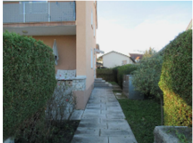
Zugang zum Haus