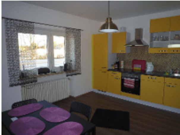
Wohnküche mit EBK