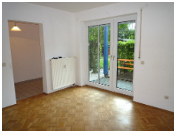
...Zugang in die Küche