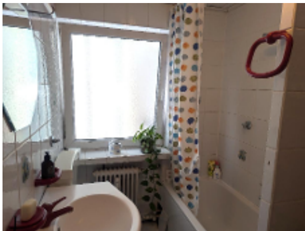
Bad mit Wanne