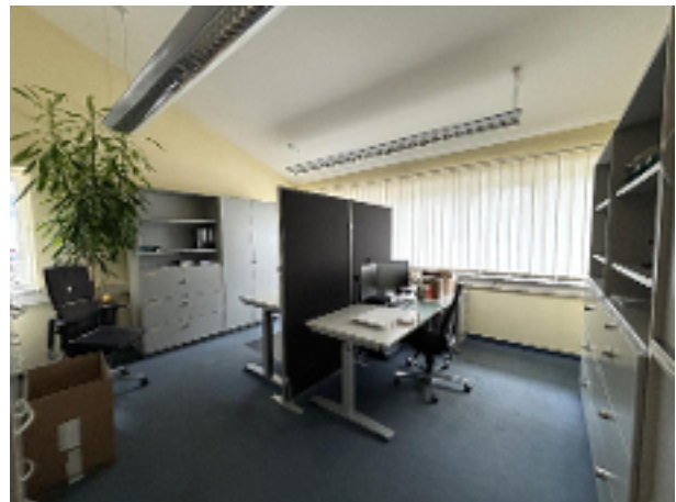
Büro 2 EG