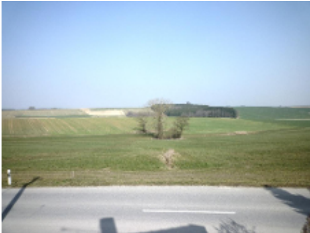
Blick aus dem Fenster