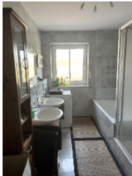
Bad mit Wanne und Dusche