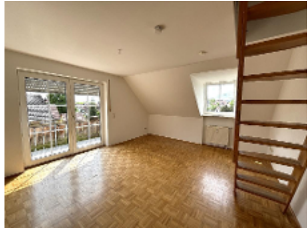
Wohnzimmer mit Treppe...