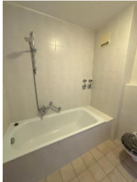
Bad mit Wanne