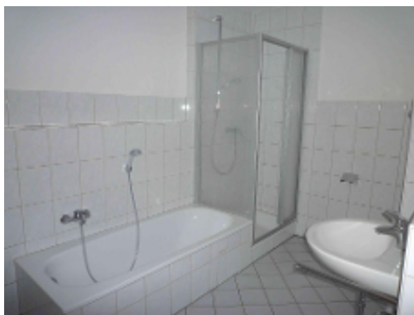
Bad mit Wanne und Dusche