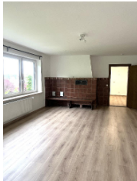
...Zugang in die...