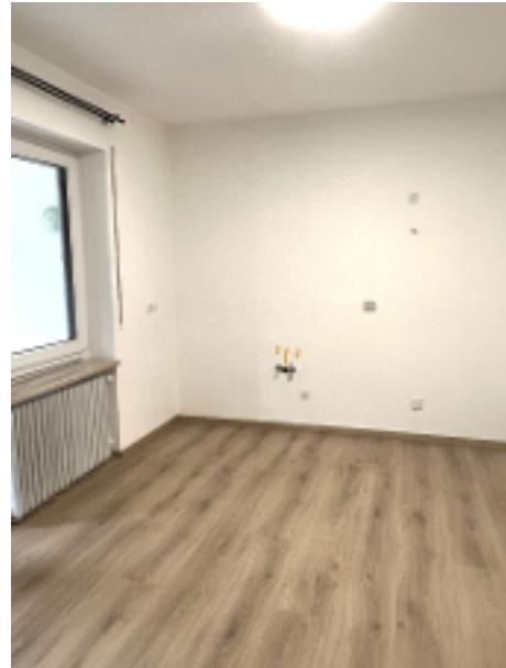
Küche mit Zugang zur...