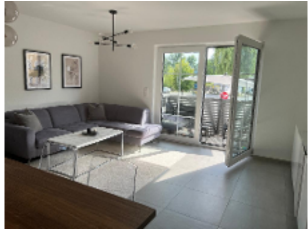
Wohnzimmer Bild 2