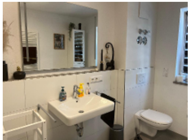
Bad Bild 2