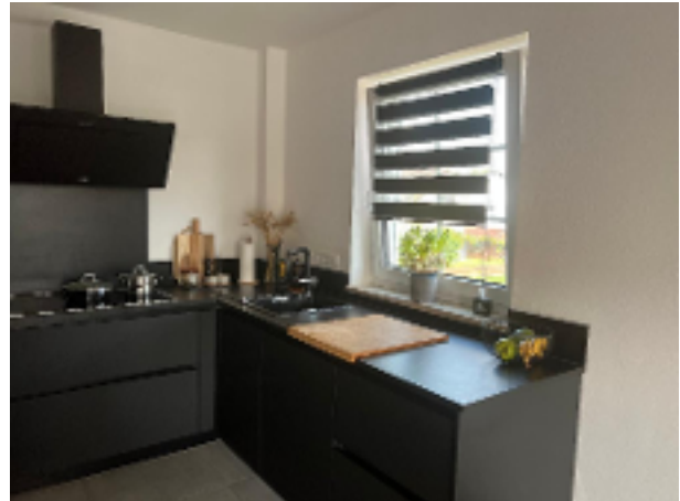
Küche Bild 2