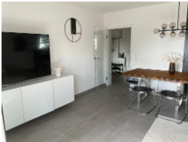
Wohnzimmer Bild 3