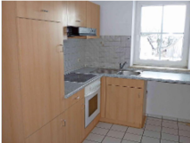
Küche mit EBK