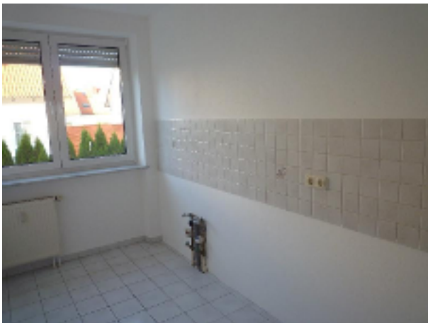
...in die Küche